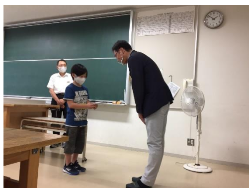
市長から児童へ快段目盛定規のお渡し